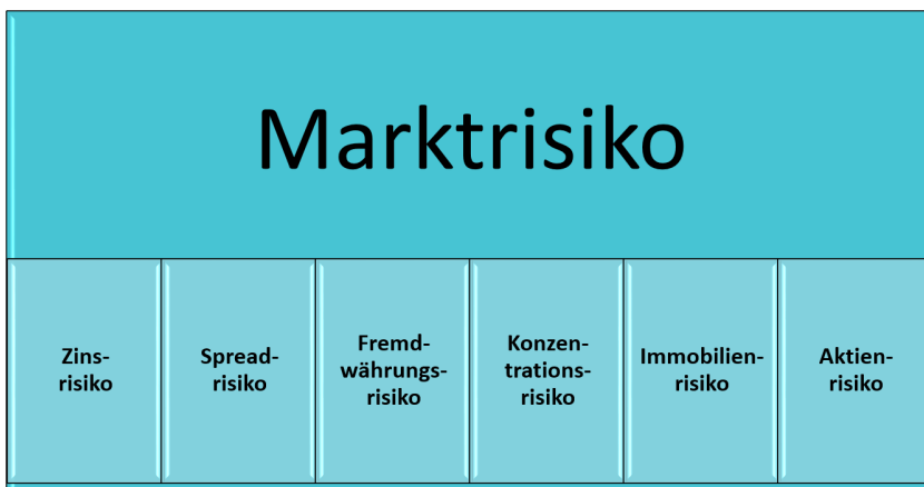
Abbildung-2: SCR-Berechnung in PMS für Marktrisiken

Will ein Fonds attraktiv für Versicherungsunternehmen bleiben, sollten die Versicherer über detaillierte Fondsinformationen zu dessen Zusammenstellung und zu den SCR-Kennzahlen der einzelnen Asset-Subklassen (Look Through Approach = LTA) (Abbildung-1) verfügen, um die Eigenkapitalhinterlegung für den Versicherer so gering wie möglich halten zu können.